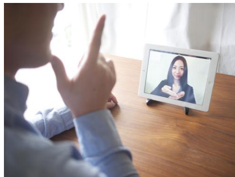
手話通訳サービスイメージ